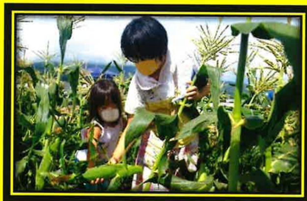
☆甘さで勝負の昭和村のとうもろこしを自分の手で収穫！