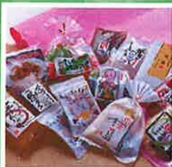
こんにやく(さしみ、湯葉他)