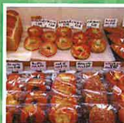
ベーグル、舞茸パリパリピザ他