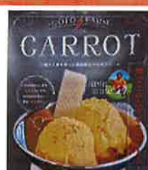
にんじんアイス・ジュース