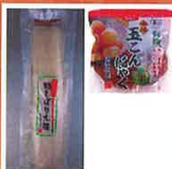
おつけもの、こんにやく