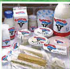
乳製品(チーズ、ヨーグルト他)