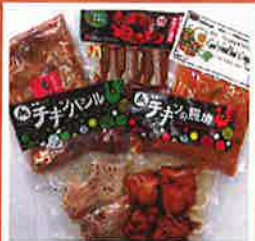
唐揚げ、焼き鳥製品