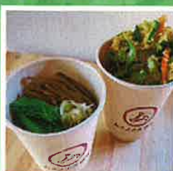
自家製麺カップうどん